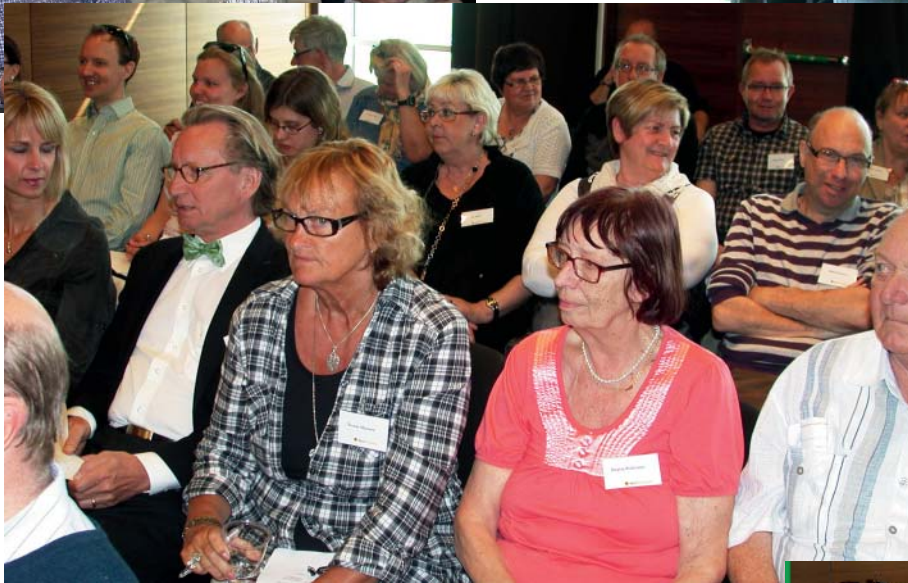
Ombud för regionföreningarna och förbundsstyrelsen, valberedningen och inbjudna gäster samlade till förbundsstämma i maj 2011.