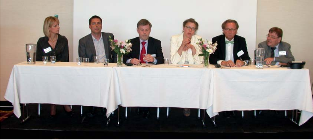
I samband med förbundsstämman i maj 2011 i Stockholm arrangerades ett seminarium ang Donation och transplantation och paneldebatt med experter från vård och myndigheter.