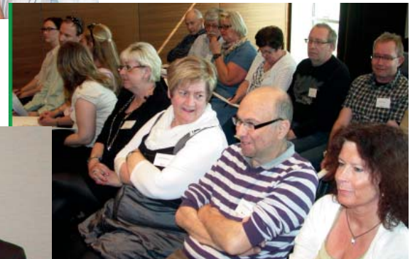
Nedan: Ledamöter och ordförande i förbundsstyrelsen, som valdes vid stämman.