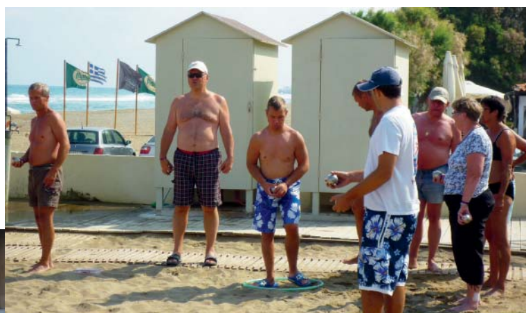
Ovan: Delatagare på förbundets gruppresna för hemodialyserande med anhöriga till Kreta i september 2011.