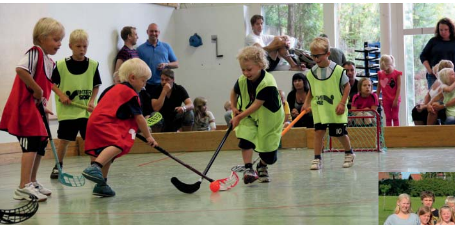
Sommarveckan för njurjsuka barn med familjer som arrangeras varje sommar är ett viktigt stöd för hela familjen.