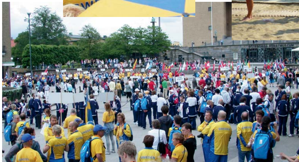
Tv. Svenska deltagare på World Transplant Games i Göteborg i juni 2011, där svenska njurtransplanterade deltog tillsammans med transplanterade från hela världen. Njurförbundet var inte arrangör men stödde arrangemanget.